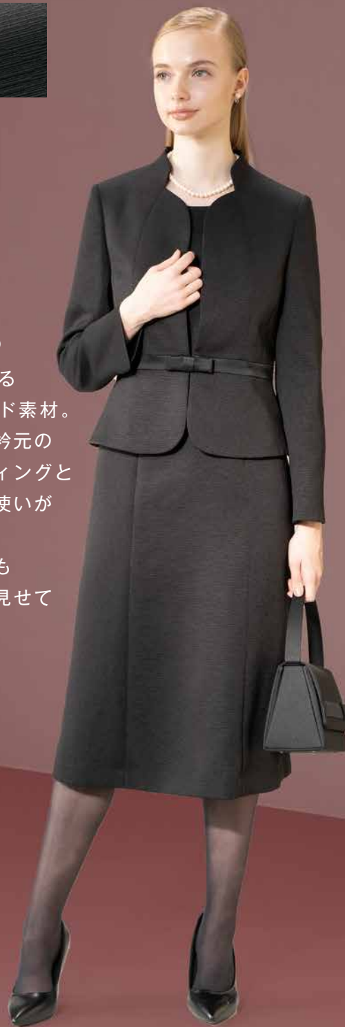
One Piece Style

高級感あふれる 北陸ジャガード素材。 ジャケットの衿元の 美しいカッティングと サテンの部分使いが お洒落。 ペプラム切替も スタイル良く見せて くれます。