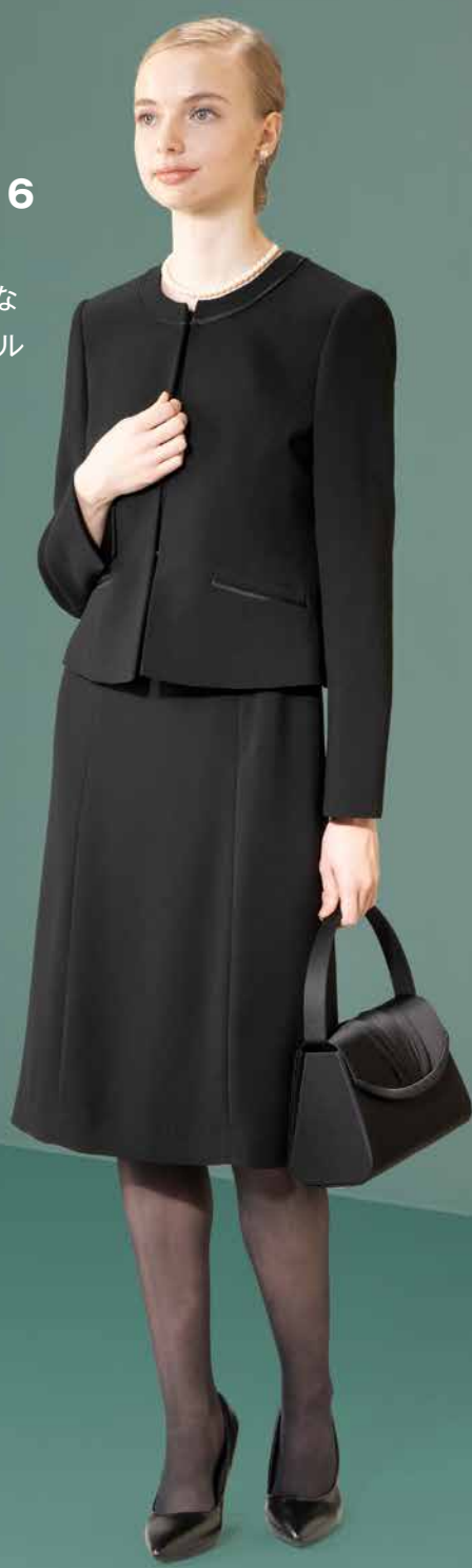
One Piece Style